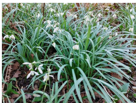
Kornellkirsche, Krikus, Schneeglöckchen und Schlüsselblume sind Beispiele für wichtige Frühblüher